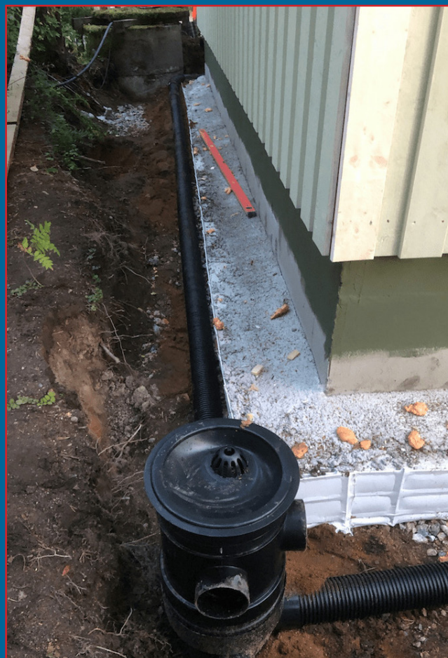
Combi Drain med dräneringsrör anslutna.